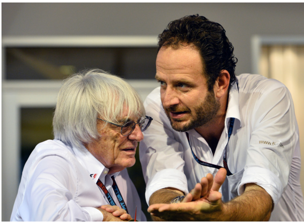
Overleg met de organisatoren hoort bij het vak.

‘WE WILLEN ER MET Z’N ALLEN VOOR ZORGEN DAT ELKE FAN ER BIJ DE START VAN EEN RACE EENS GOED VOOR GAAT ZITTEN’