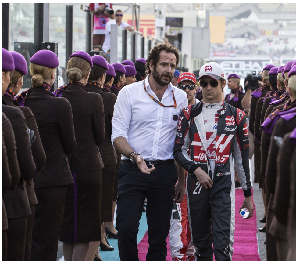
▼ Bonciani heeft een goede band met de coureurs.